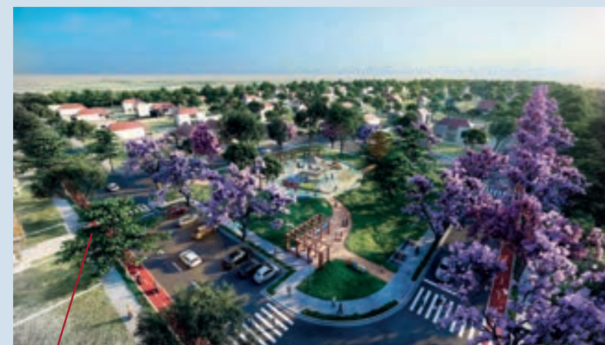
Foz do Iguaçu

Abordagem multidisciplinar. Diferentes pontos de vista. Projetos com identidade própria.