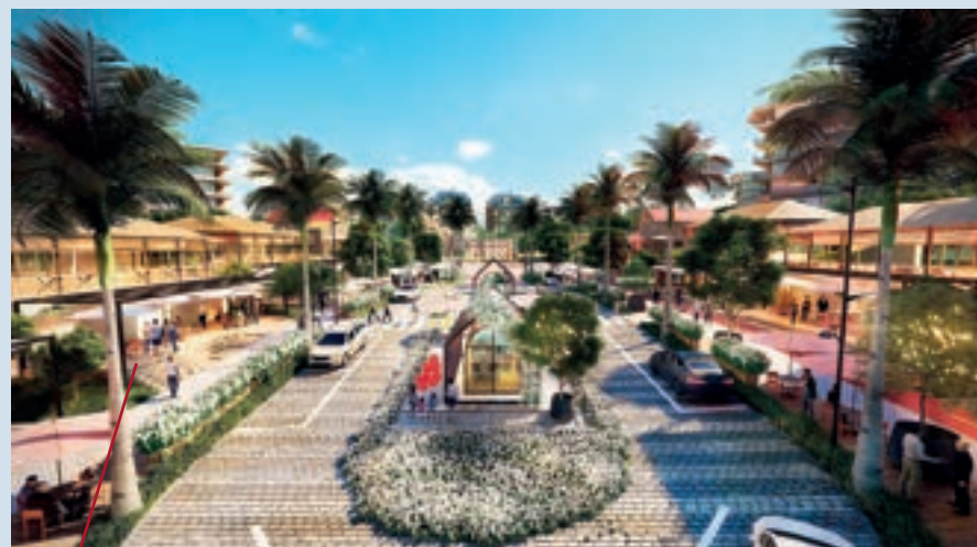
Silvestre Park Rio Verde