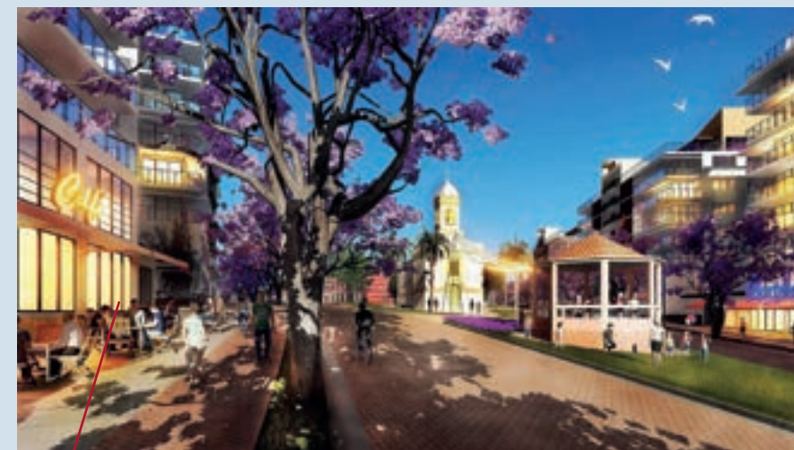
Terra Brasilis Aquiraz