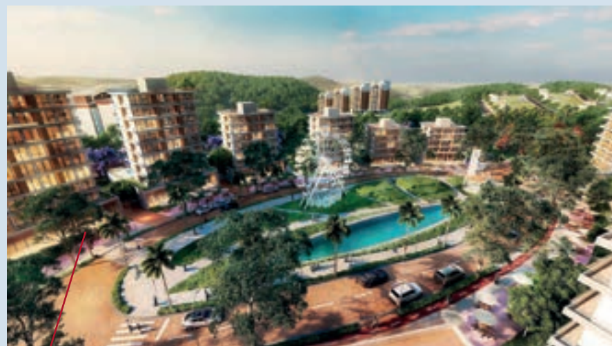
Mosteiro São Bento