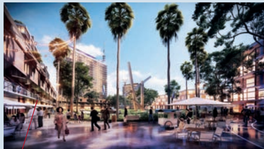
Nova Santa Rita